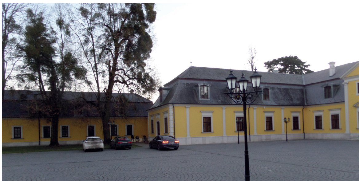
Wellness szárny épülete