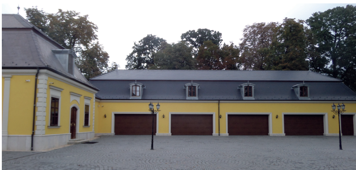
Gépkocsitároló szárny épülete