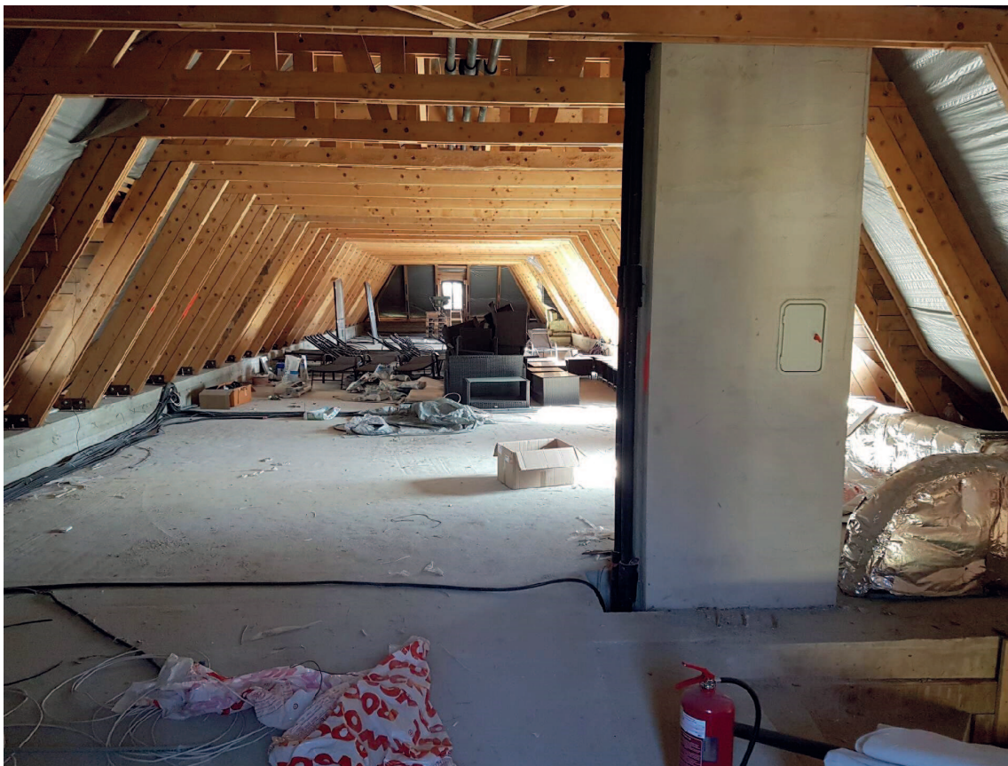
Wellness szárny épülete – tetőtér