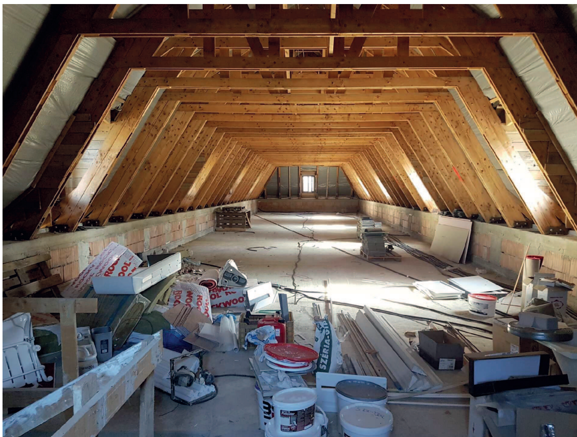
Gépkocsitároló szárny épülete - tetőtér